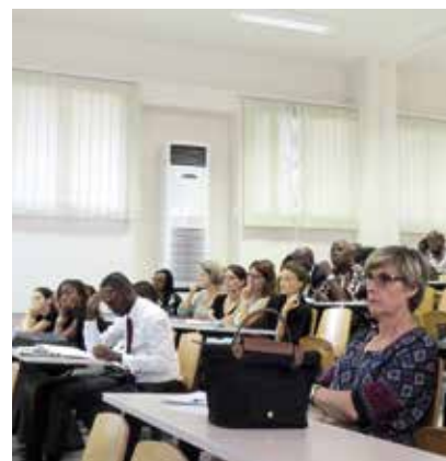
Conférence sur l'identité numérique donnée aux enseignants et aux parents dans le cadre d'une mission de formation aux documentalistes au lycée international Jean-Mermoz (Abidjan, Côte d'Ivoire)

Profdoc, un métier à part entière, complexe et exigeant