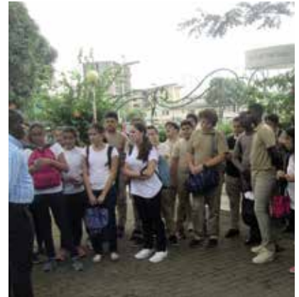
Visite des élèves de deux classes de 4 e du lycée international Jean-Mermoz, à Fraternité Matin, quotidien ivoirien

Dans le cadre des personnels de la Mlf, il conviendra de clarifier et d'harmoniser ces textes afin de les adapter aux contextes locaux et aux réalités du terrain.