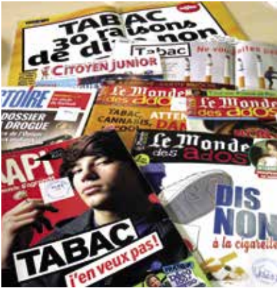
Magazines, Semaine de la presse, CDI du lycée Molière (Villanueva de la Cañada, Espagne)