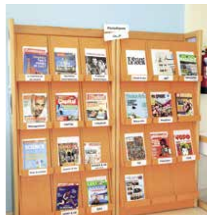
Journaux, périodiques et magazines de la bibliothèque du centre de documentation du Grand lycée franco libanais, (Beyrouth, Liban)

Profdoc, un métier à part entière, complexe et exigeant