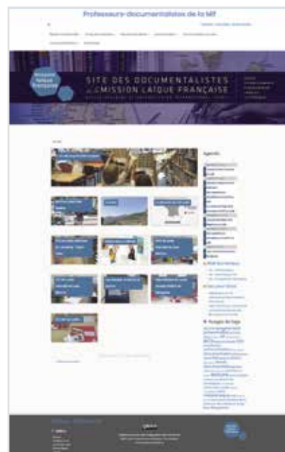
Le site des documentalistes vient compléter l'écosystème du réseau mlfmonde