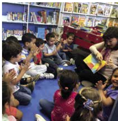
Activités dans la médiathèque du lycée René-Verneau (Gran Canaria, Espagne)

La question du statut enseignant est enfin essentielle qu'il s'agisse du contenu pédagogique de la mission première des profsdocs, partant de leur légitimité au sein des équipes d'enseignants ou de la reconnaissance de former des citoyens et des cybercitoyens responsables. C'est dans ce cadre de formation des élèves que l'élaboration d'un référentiel de compétences autour de la maîtrise de l'information-documentation et de l'EMI devient un enjeu crucial.