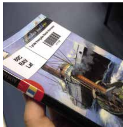
Identification du fonds local sur le dos d'un livre de la médiathèque du lycée René-Verneau (Gran Canaria, Espagne)

L'ouverture de l'établissement et la politique de lecture sont deux axes forts de cette mission du profdoc. Ce dernier apporte son expertise