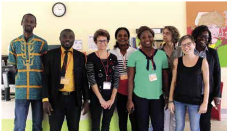
Stage de documentalistes, médiathèque du lycée international Jean-Mermoz (Abidjan, Côte d'Ivoire)

ci-dessus. Si nous avons déjà abordé par la circulaire les compétences spécifiques des profsdocs, il nous semble important de rappeler celles citées dans les deux catégories plus larges du référentiel, notamment :