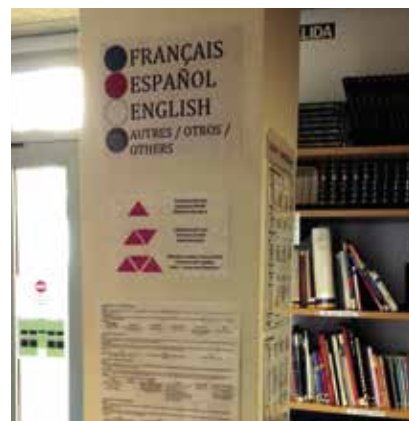
Signalétique de la médiathèque du lycée René-Verneau (Gran Canaria, Espagne)