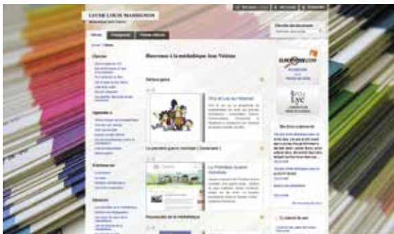
Page d'accueil du portail ESIDOC du lycée Louis-Massignon (Maroc)