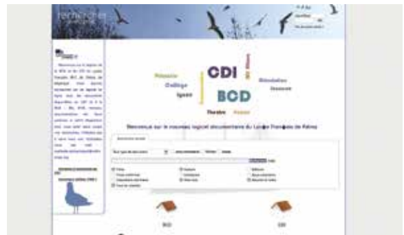
Page d'accueil du catalogue en ligne du lycée français de Palma (Espagne) créé avec PMB