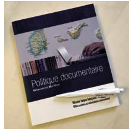
Le référentiel Politique documentaire a été publié en 2013

Quatre années plus tard, et après la fédération de plusieurs réseaux