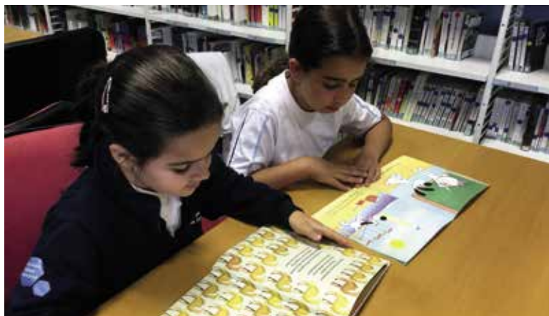
Rallye lecture, élèves de CE2, dans la médiathèque du lycée René-Verneau (Gran Canaria, Espagne)

Enfin, un dernier paragraphe rappelle qu'il est possible aux profsdocs s'ils en sont d'accord « d'assurer des missions particulières (réfèrent numérique, réfèrent culture, etc.) définies par le décret n° 2015-475 du 27 avril 2015 et la circulaire n° 2015-058 du 29 avril 2015 » pour lesquels ils percevront des IMP (indemnités pour mission particulière) en plus de leurs missions statutaires.