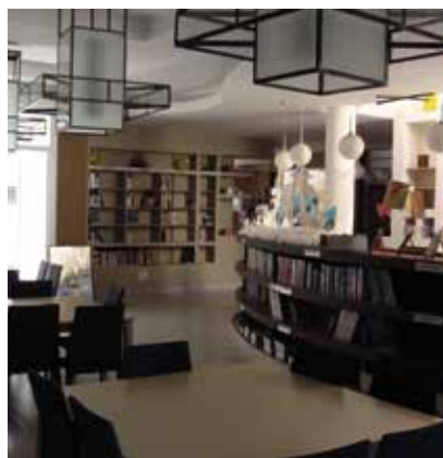
Centre de documentation et d'information du lycée Jean-Charcot (El Jadida, Maroc)

✔ Agir au sein d'un réseau de documentation scolaire en vue d'assurer des relations entre les niveaux d'enseignement et d'optimiser leurs ressources.