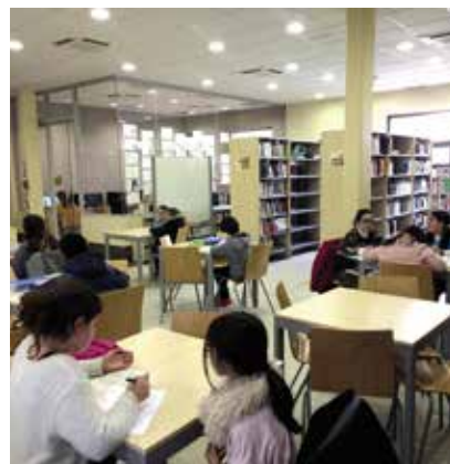
Médiathèque du lycée Molière (Villanueva de la Cañada, Espagne)

Profdoc, un métier à part entière, complexe et exigeant