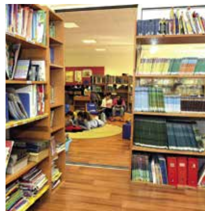
La bibliothèque centre de documentation du lycée franco-libanais Mf Alphonse de Lamartine (Tripoli, Liban)