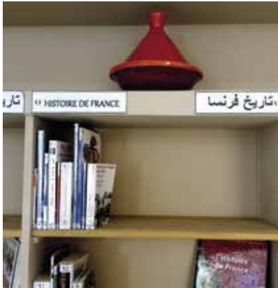
Fonds documentaire de la médiathèque Meriem Chadid du lycée international Jean-Charcot (El Jadida, Maroc)