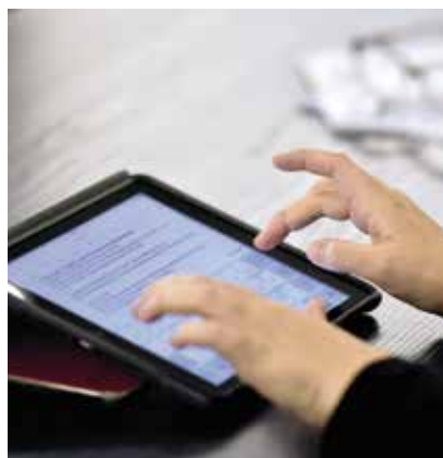
Les tablettes sont de plus en plus utilisées dans le cadre de recherches documentaires

7 - Cet acronyme « BYOD » est l'abréviation de l'expression anglaise Bring Your Own Device . En français, on utilise parfois AVAN « Apportez Votre Appareil Numérique » : cet usage consiste à travailler en apportant ses propres outils numériques (tablette, smartphone...).