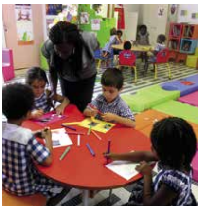
La marmothèque du lycée international Jean-Mermoz (Abidjan, Côte d'Ivoire)

conviendra donc de travailler en parallèle sur un référentiel de compétences en information-documentation 1 qui puisse servir de cadre aux documentalistes en poste dans les établissements de la Mlf intégrant si possible les aspects spécifiques au contexte culturel et linguistique du pays d'implantation. Nous y reviendrons.